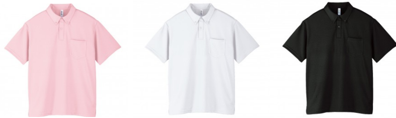
ライトピンク ホワイト ブラック