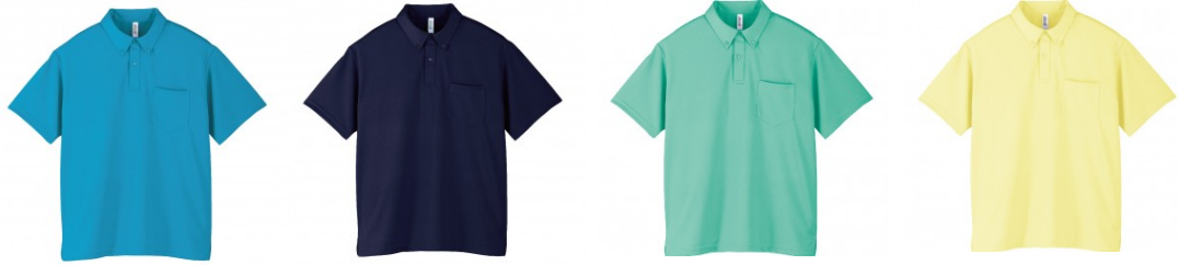
ターコイズ ネイビー ミントグリーン ライトイエロー