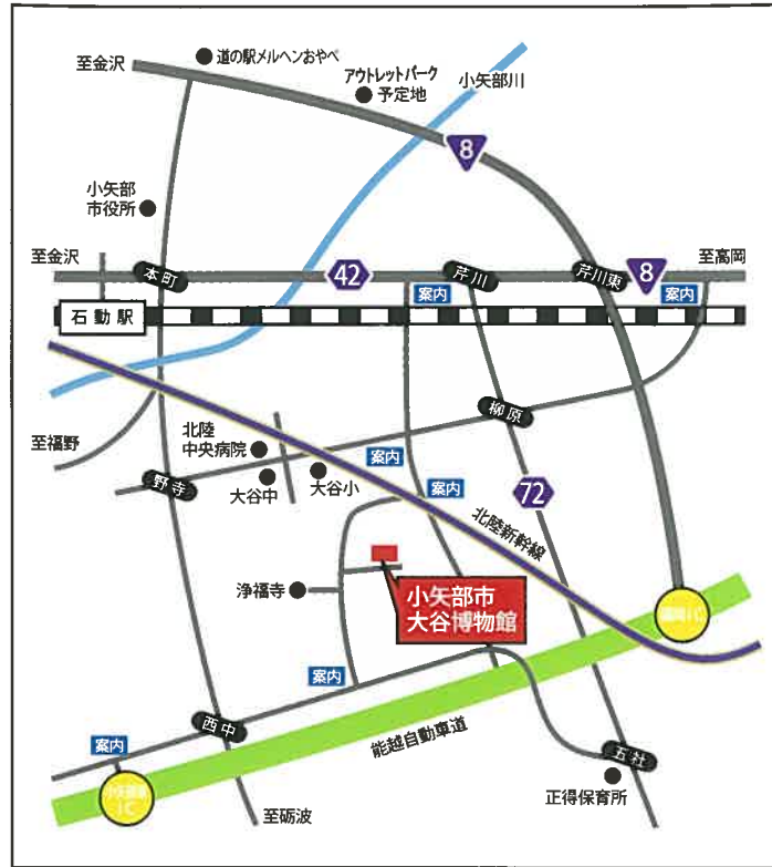
案内 …博物館案内板